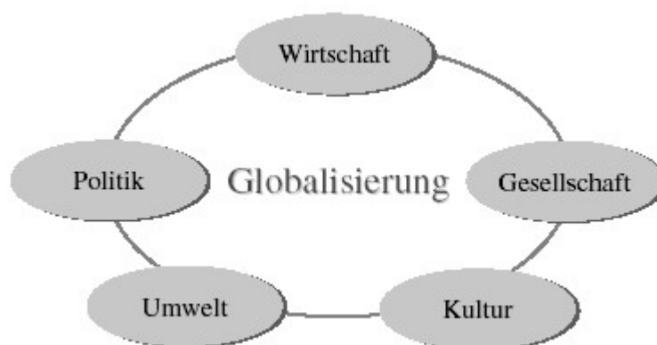
Abbildung 2-1: Globalisierung

Eine andere, wenig gebräuchliche Bezeichnung ist Mondialisierung (nach dem im Französischen bevorzugten Begriff Mondialisation). Einige bezeichnen den beschriebenen Prozess nicht als Globalisierung, sondern als Entnationalisierung oder Denationalisierung, um auszudrücken, dass der Nationalstaat im Zuge der Globalisierung immer mehr an Macht und Bedeutung verliert. 2